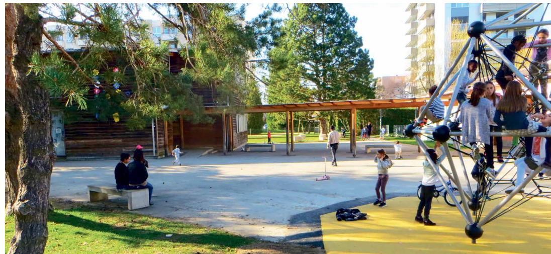
Un premier aménagement à Pierre-de-Savoie: un grand jeu, des assises, de la verdure pour les enfants et le quartier.