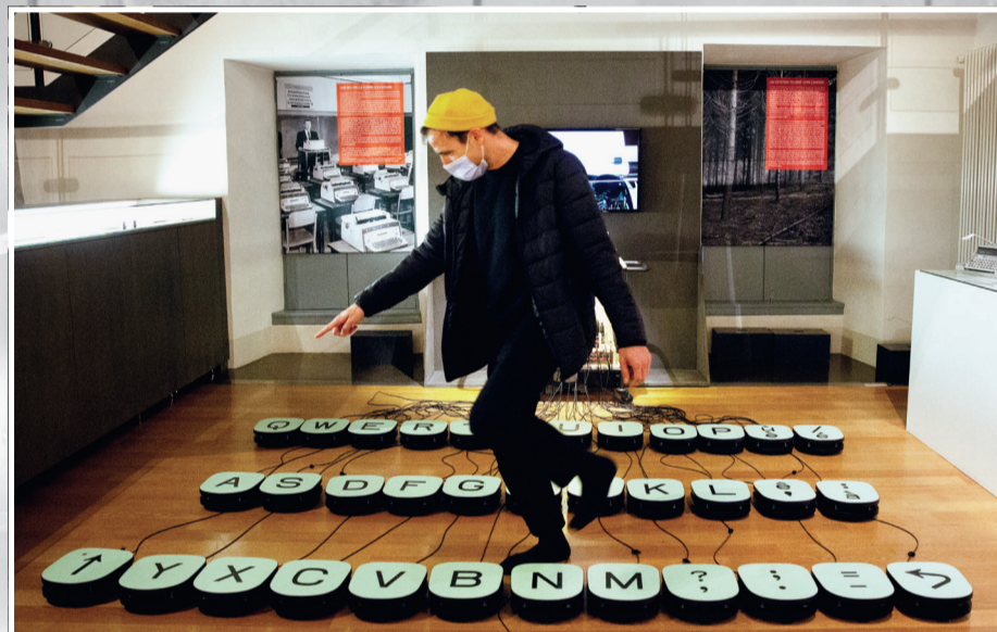
EXPOSITION ROCK ME BABY Octobre 2020