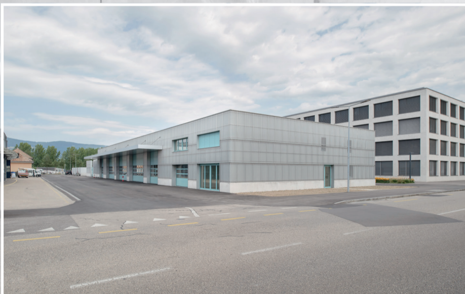
NOUVELLE CASERNE SDIS NV/PNV Août 2020