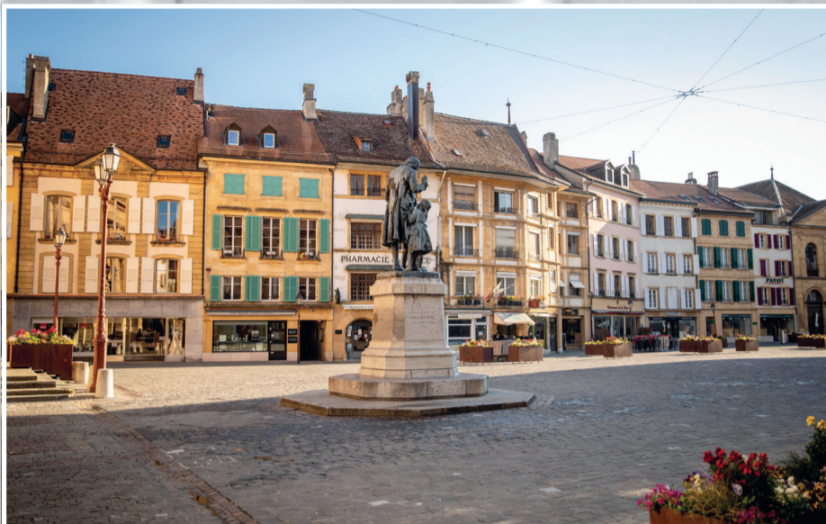
SEMI-CONFINEMENT À YVERDON-LES-BAINS Mars à juin 2020