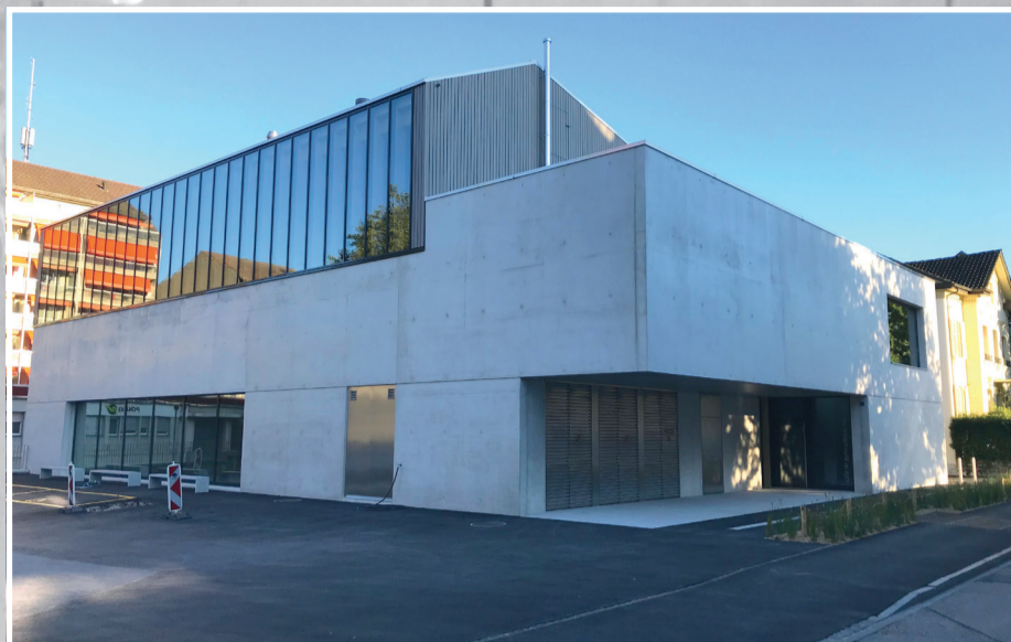
NOUVELLE SALLE DE GYM PESTALOZZI Août 2020