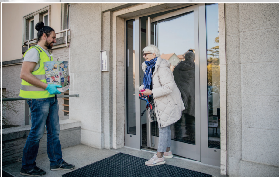
INITIATIVE VILLE D'YVERDON SOLIDAIRE Mars à juin 2020