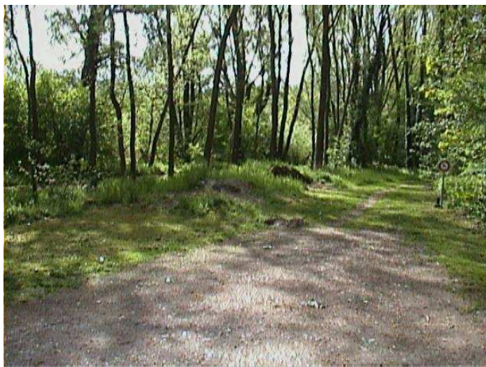
Photo 4: Depuis les Menhirs (2 chemins parallèles dont un autorisé aux vélos)

Photo 3: Départ Grève de Clendy vers Menhirs (2 chemins parallèles, l'un à autoriser aux vélos)