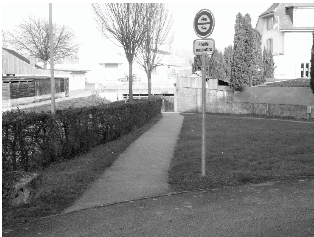
Photo n°1 – Le chemin devient étroit lorsqu'on quitte le préau du collège (F06-6379.gif)

Fiche descriptive et proposition(s) d'aménagement(s)