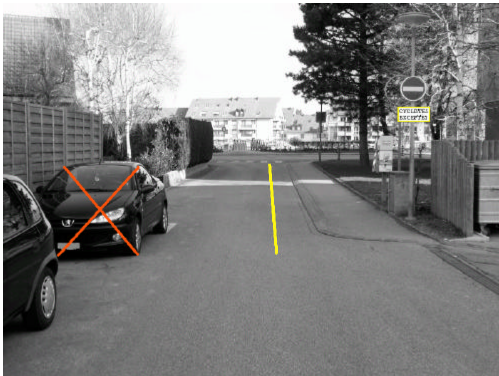
Photo n°2 – Bande cyclable à créer et suppression de deux places de parc (G01-6336.gif)

Fiche descriptive et proposition(s) d'aménagement(s)