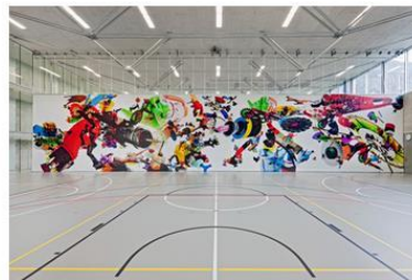
Salles de gymnastique, Martigny 2011 - Maria Ceppi Rideau coloré

Et voici le dernier exemple, une fresque qui a été faite de manière participative avec des élèves. Et ce sera aussi potentiellement le souci qu'on aura, cette volonté qu'on aura dans ce projet de collège. Ici donc, une toile qui est posée sur ces structures amovibles qui séparent les salles de gym.