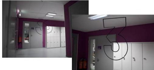
HEAD, Genève 2011 - Annelore Schneider du Collectif Fact Exemple de signalétique