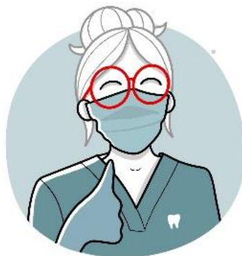
Ilustracija zasluga : LU.TH

Vaš pedijatar, koji će prilikom prvih pregleda i vakcinacija pregledati zube vašeg deteta može vas posavetovati o nezi prvih zubića. Ukoliko je potrebno uputiće vas stomatologu.