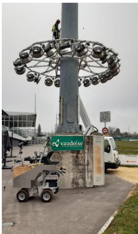
Figure 1: Mâts actuels avec couronne mobile

Le nouvel éclairage compte trois projecteurs de plus par mâts ; les projecteurs LED sont aussi plus lourds que les projecteurs actuels et présentent une plus grande surface au vent. La future charge sera donc plus grande au niveau du poids et de la surface au vent, particulièrement exposée à cet endroit. Il est ainsi fortement recommandé de remplacer les mâts actuels par des nouveaux, dimensionnés en fonction de la charge du futur éclairage.