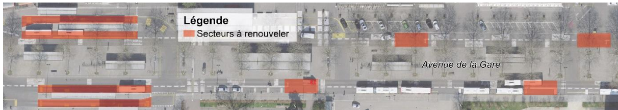
Figure 4 – Périmètre de l'intervention à l'Avenue de la Gare