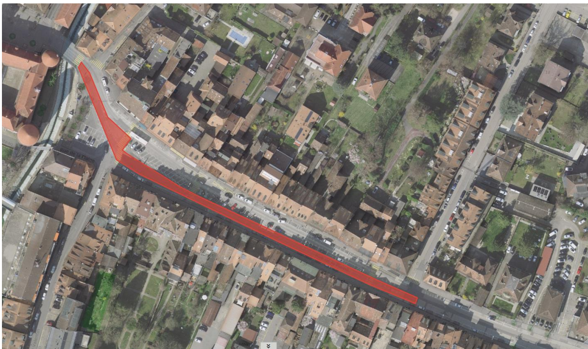
Figure 5 - Périmètre de l'intervention de réfection à la rue de la Plaine

Le périmètre du projet concerne la voie de roulement « sud » de la rue de la Plaine sur le tronçon « Canal oriental / rue Saint-Roch », sans toutefois toucher les zones de stationnement dont l'état est acceptable à court terme.