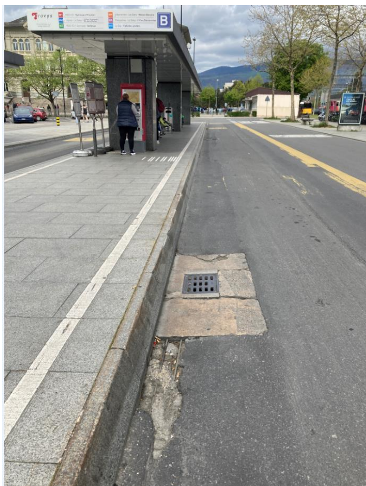
Figure 2 - Exemple de dégradations à l'Avenue de la Gare (quai B)

Toujours dans le domaine de l'entretien du réseau routier, le secteur de la gare fait actuellement l'objet de plaintes répétées de la part des exploitants des transports publics, en particulier de la part de notre partenaire TRAVYS SA, en raison de la dégradation avancée de la chaussée au niveau des quais des bus.