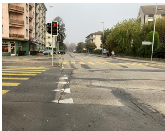
Figure 1 - Exemples de dégradations à la Rue du Curtil-Maillet et au carrefour Rue d'Orbe/Rue du Cheminet