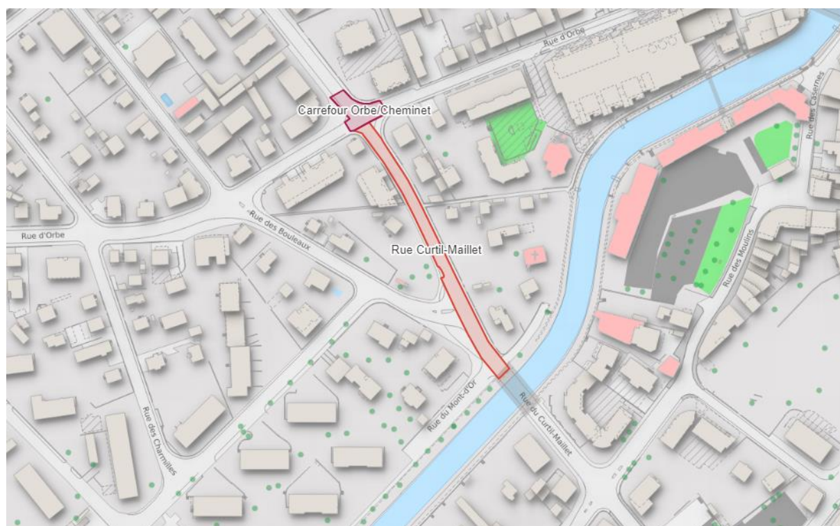
Figure 3 – Périmètre d'interventions d'assainissement et réfection de la chaussée (axe Curtil-Maillet – Cheminet)